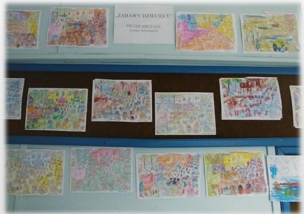
„ZABAWY DZIECIĘCE” PIETER BRUEGEL (malarz holenderski)